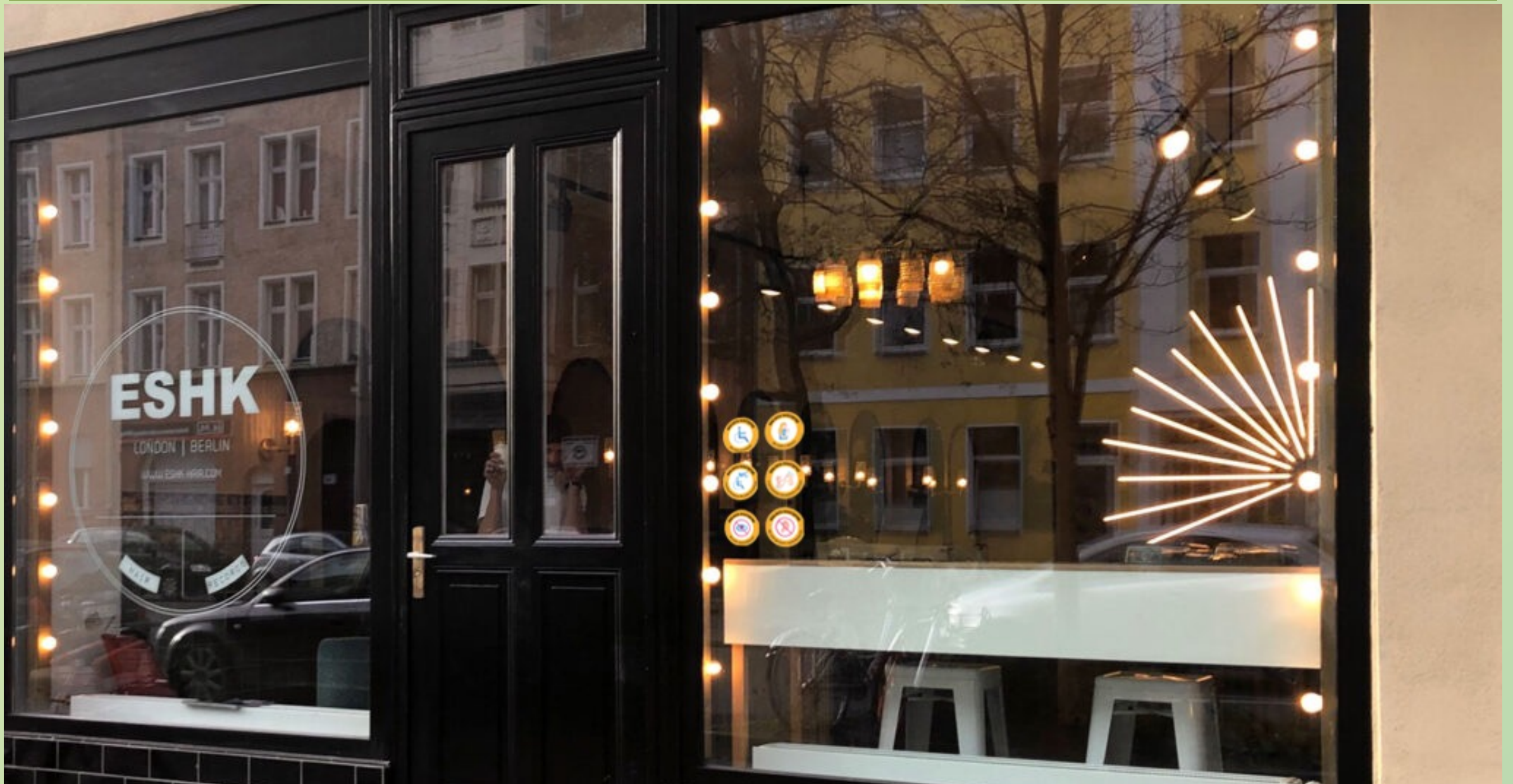
Przykładowy salon z naklejkami, opracowanie własne na podstawie ESHK